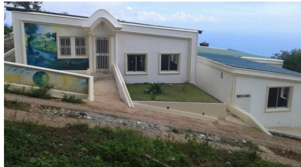
L'Ecole Communautaire Gérard Baptiste rénovée (septembre 2017)

En Conclusion, il faut féliciter l'APV de son action pour le rétablissement des infrastructures de Vallue dont le toit de l'école, la laiterie et l'atelier de fabrication de confiture qui, à des titres divers, dont l'accès à l'eau, ont été endommagés par l'ouragan, tout en assurant le fonctionnement de l'école. Il faut aussi remercier le personnel enseignant pour cette année fructueuse malgré les conditions difficiles.