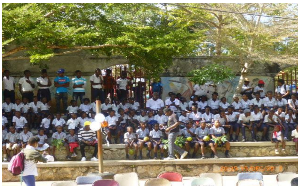
Le stade « Jacques Roumain » lors de la 8 e Foire de la Montagne

Après une semaine à Port-au-Prince, en mission pour le CHF, nous avons passé une semaine à Vallue, pour faire le point sur nos actions communes avec nos partenaires de l'Association des Paysans de Vallue (APV)