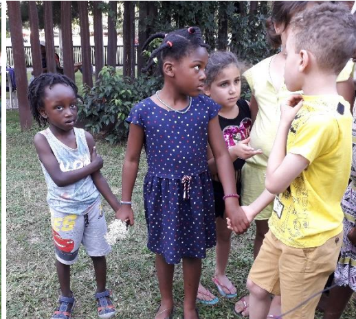
Lecture de pensées de Nelson Mandela par les adultes et les enfants