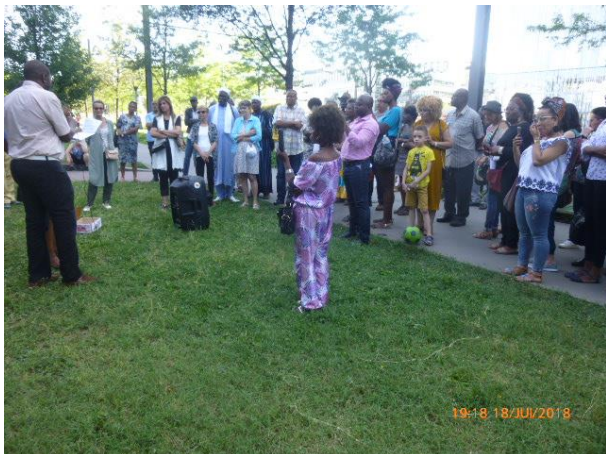
Les participants avec 2 représentantes de LHP.