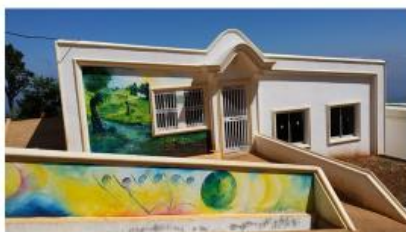
Ecole Communautaire Gérard Baptiste de Vallue (ECGBV)