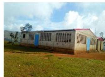
Ecole Communautaire Odilus Jean Louis de Piton (ECOJ)