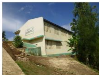
Ecole Communautaire de Floquette (ECF)