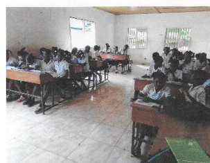
Vallue, Octobre 2020

RAPPORT RENTRÉE DES CLASSE ANNÉE ACADEMIQUE 2020/2021.