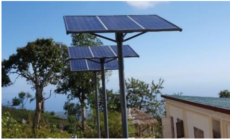
Panneaux photovoltaïques ECGBV