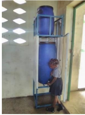
Purificateur d'eau Floquette