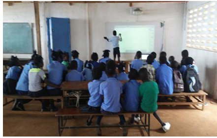
TNI école de Piton