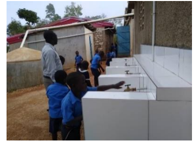
Lavabos école de Piton