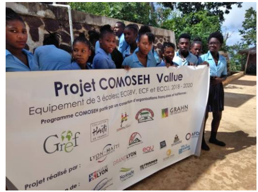
Elèves devant panneau des bailleurs du projet

Un nouveau projet « Cantine scolaire » à l'ECGBV (Ecole Communautaire Gérard Baptiste de Vallue) est à l'étude pour être soumis fin mars à la Fondation BEL : à suivre dans notre prochaine Lettre Info.